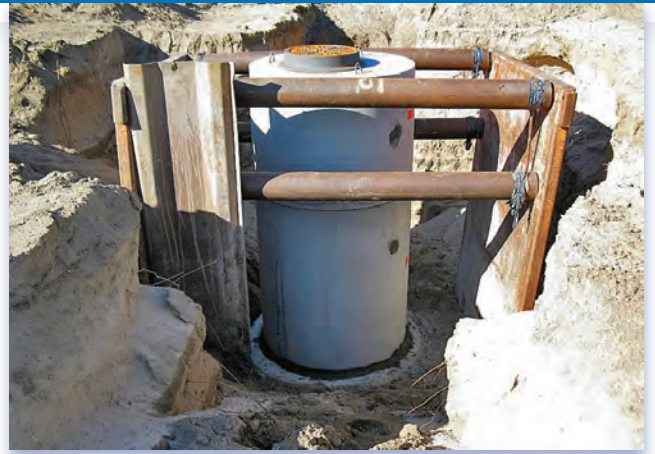
Pozo de acceso

El Departamento Regional de la Recuperación del Drenaje Sanitario del Condado Pima (RWRD) y su contratista Borderland Construcción comenzara la obra de aumentación de drenaje de la Avenida Park (PAS por sus siglas en ingles) el 30 de mayo del 2017. El proyecto de Aumentación va mejorar una porción del drenaje existente e instalara una línea de drenaje nueva de 10 pulgadas a lo largo de la calle Drexel desde la Avenida Park hasta la Primera Avenida. Esto es parte de un proyecto más grande que también aumentara el Interceptor de Viejo Nogales (ONI por sus siglas en ingles) desde la calle 36 hasta la calle Old Vail y va construir el nuevo drenaje Corredor Aeroespacial (ASC por sus siglas en ingles) a lo largo de la calle Old Vail desde la calle Nogales Highway hasta la Prisión Wilmot.