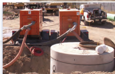
Bomba de recirculación y pozo de acceso

Para información adicional visite la página www.sewerimprovements.info para informes al día de la construcción o llame a la línea de información 520-622-2527 o mande un correo electrónico a info@sewerimprovements.info